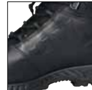
Schuhinnenseite aus sehr abriebfestem Leder - keine Nähte im Seilführungsbereich; sehr gut geeignet für „Fast Roping“.