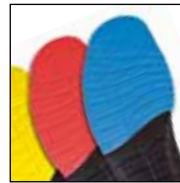
Vario Wide Fit System