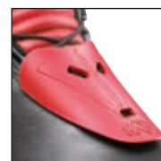
HAIX® 3Z Protector System