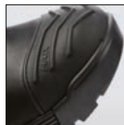
HAIX® HD Cap System