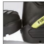
HAIX® ES Out System