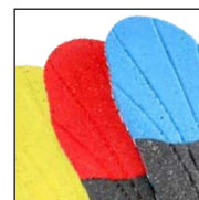
HAIX® Vario Wide Fit System