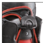
HAIX® FL Fit System